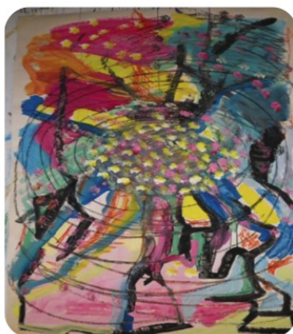
Figur 3. Det indre og det ydre forbindes ved at bruge spiralen som symbol

Ved at sammenligne det første og det sidste udtryk blev det synligt at en selvregulering havde fundet sted i det terapeutiske forløb, forstærket af at deltagerne ikke havde set deres første udtryk siden de lavede det 6 måneder tidligere. Evnen til at regulere en ubalance i bevidstheden var en af Jungs vigtigste opdagelser relateret til selvets funktion, og jeg mener i dette projekt at have påvist det selv-helende aspekt ved depression. Projektet viser, at når der gives mulighed for aktivt at forholde sig til indre konflikter, så begynder selvreguleringsprocessen at arbejde. Bevægelsen igennem egocide, indvielse og tilbagekomst, kunne findes i drømmenes temaer, kreative udtryk samt terapeutiske dialoger. Det antyder, at en dårlig livskvalitet kan blive starten på en individualisations proces, hvilket var et af de temaer som jeg ønskede at undersøge.