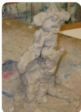
Figur 2. Figuren har en yderside og en inderside og de er ikke forbundet med hinanden. Hun viser kun ydersiden og længes efter også at vise indersiden .

Fra analysen af den terapeutiske proces hos deltagerne viste det sig at jeg-selv relationen var blevet forbedret. Det fremgik mest tydeligt af sammenligningsanalysen, hvor f.eks. det første og sidste kreative udtryk blev sammenholdt, som vist i følgende eksempel: